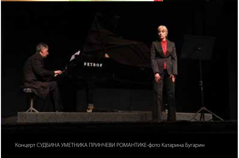
Концерт СУДБИНА УМЕТНИКА ПРИНЧЕВИ РОМАНТИКЕ