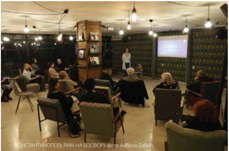
КОНСТАНТИНОПОЉ РИМ НА БОСФОРУ

Месечно. - Корични наслов: ДКСГ. Програм Дома културе Студентски град. ISSN 1451-7272 = Program - Dom kulture "Studentski grad" COBISS.SR-ID 112335084